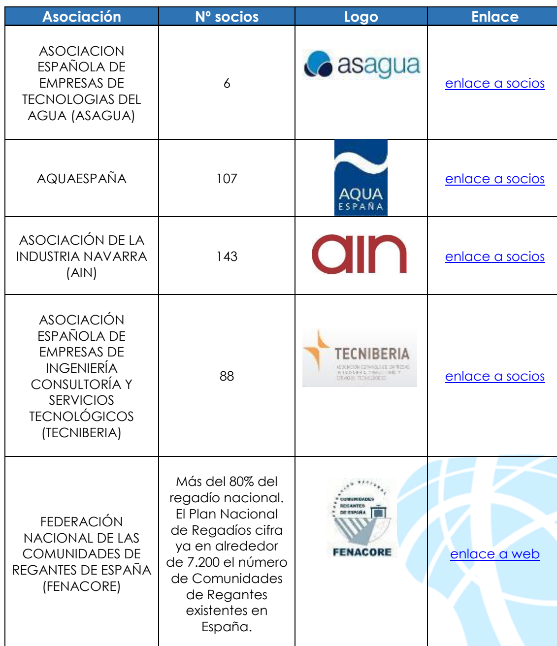
Tabla 1.- Asociaciones miembro de la PTEA

A continuación se han recopilado las asociaciones que son miembro de la PTEA, con enlace a sus listados de asociados: